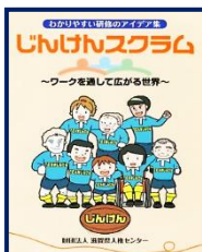
⑨じんけんスクラム 15~20分程度のワークショップを12個紹介。テーマは「固定観念」「職場の人権」「ことば」など。