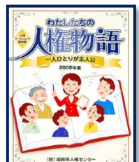
⑦わたしたちの人権物語