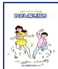
⑤わたし解き放ち 様々な角度から22のテーマで学ぶワークショップ集