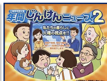
⑪年間じんけんニュース2

人権に関する記念日や月間・週間を知ることで、人権課題をグッと身近なものへ。2では国際的人権デーも紹介。