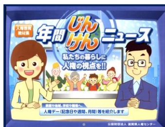
⑩年間じんけんニュース