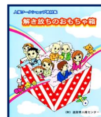
⑥ 解き放ちのおもちゃ箱