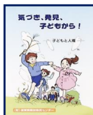
④気づき、発見、子どもから!