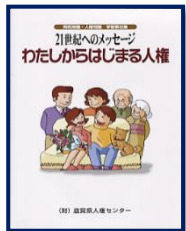
①わたしから始まる人権