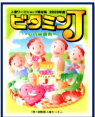
⑧ビタミンJ 進行方法やふりかえり、留意点など、記入シートを使って即実践!